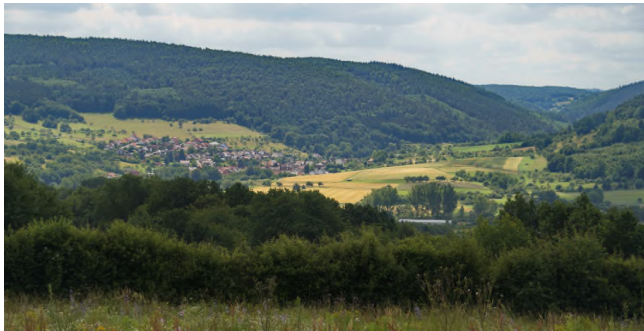
Blick auf Boxtal

Der Gedenkstein „Auf dem Weg“ , gestiftet vom Heimat- u. Geschichtsverein Dorfprozelten. Er symbolisiert die Gründe für den „Altenbücher Kirchweg“, nämlich Geburt, Heirat und auch das Sterben. Bevor die Gemeinde Altenbuch im Jahre 1810 eine eigene Pfarrei bekam, mussten die Bürger des Spessartortes für alle kirchliche Angelegenheiten diesen Weg nach Dorfprozelten benutzen. Um die ehemalige Bedeutung des Weges wieder ins Bewusstsein zu rufen, wurde er als europäischer Kulturweg wieder freigelegt. Er ist teilweise Bestandteil dieses Rundweges.