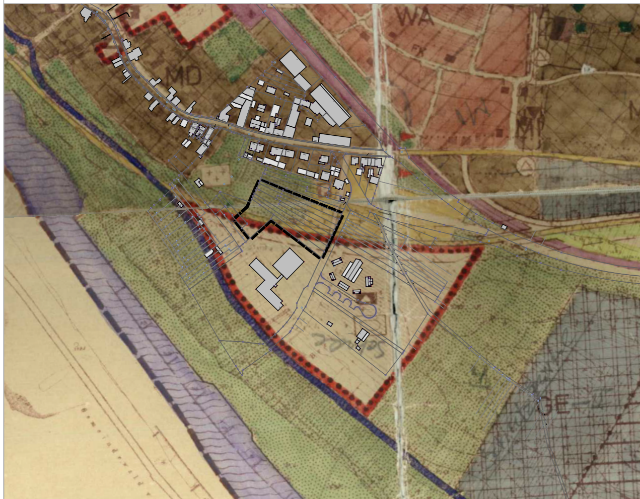
Ausschnitt aus der aktuellen Fassung des FNP mit Kennzeichnung des Geltungsbereichs