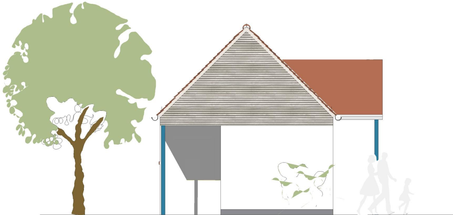
ANSICHT OSTEN Gebäude II + V