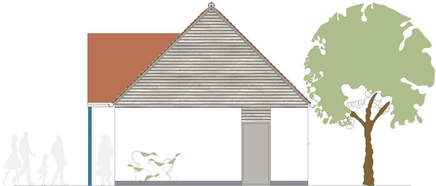
ANSICHT WESTEN Mehrzweckgebäude I