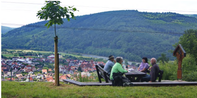
Rastplatz mit Aussicht

Der rote Bundsandstein der Weinlage "Predigtstuhl" lässt die Weinsorten Spätburgunder, Frühburgunder, St. Laurent, Domina, Dornfelder, Müller-Thurgau und Bacchus ausgezeichnet gedeihen.